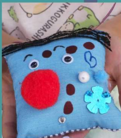
ぬいぬいふぁくとりー