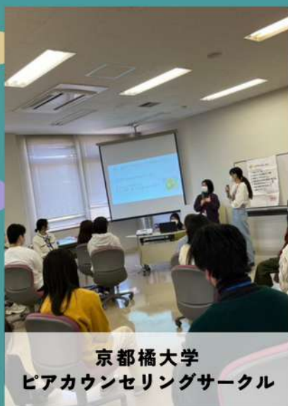
京都橋大学 ピアカウンセリングサークル