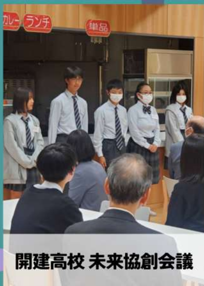
開建高校 未来協創会議