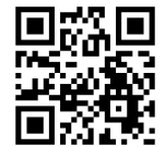
京都市新型コロナ ワクチン接種 ポータルサイト