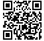
京あんしん 予約システム